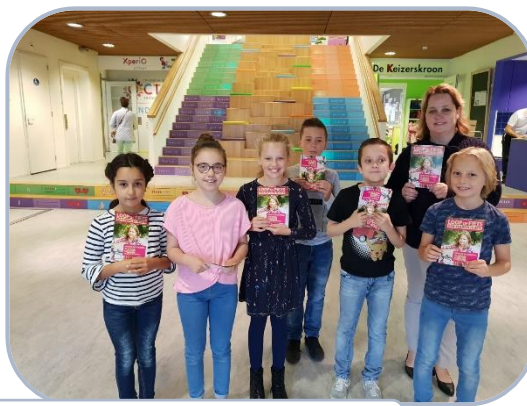
Samen met de wethouder deelde de leerlingenraad de flyers uit!